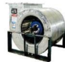
ファンモーター 静粛性に優れ、効率的な吸排気を実現