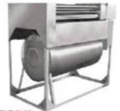
熱交換機 短時間、低消費でブース内温度を上げ