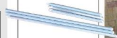
LEDライト ブース内照明は省エネ・高効率のLED ライトを採用