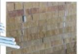
断熱パネル材 蓄い保温・遮音効果を発揮