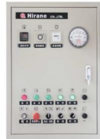
コントロールBOX シンプルでわかりやすい操作