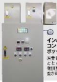
インバーター コントロール ボックス 消費電力を抑える とともに、風量の 微調整及び自動制 御が可能に