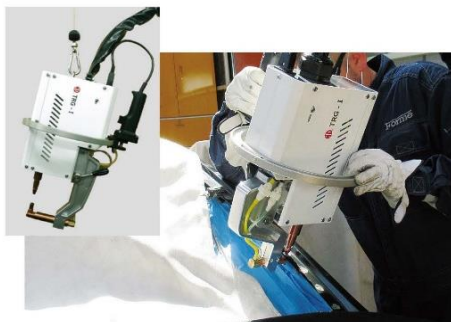
吊しワイヤーの接続位置を切り換えることで 垂直作業時にもケーブルに負担をかけずに作業可能