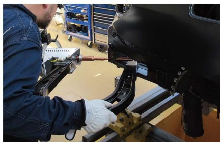
Uアーム (オプション) で、各部位への作業に対応