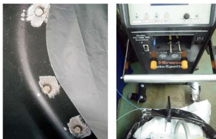
トランス内蔵のエアガンにより、省電力でも高い溶接能力を発揮