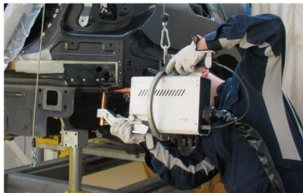
二次ケーブルが無いため、作業性が向上