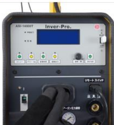
インバータスポット溶接機