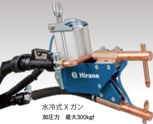
水冷式 X ガン 加圧力 最大300kgf